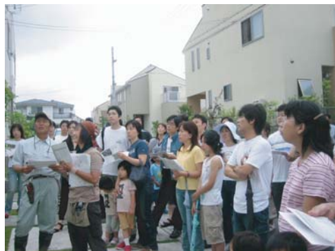
□ 薬剤散布について