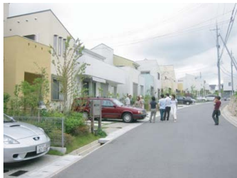
□ 各家を巡回してガーデン相談