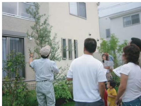
□ 樹木の剪定のしかた